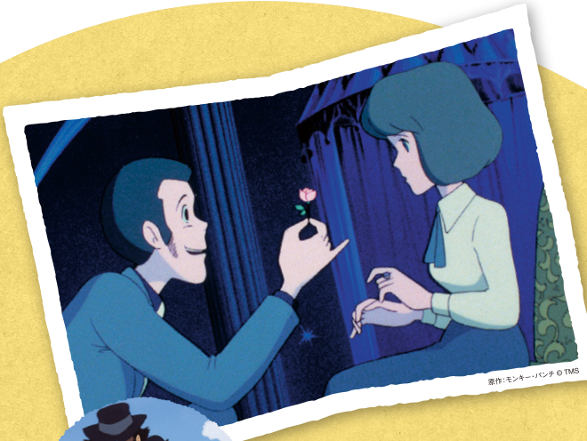
原作:モンキー・パンチのTMS

『ルパン三世カリオストロの城』。宮崎駿監督の劇場初監督作品。秘密の城「カリオストロの城」にしのびこんだルパン。囚われの少女クラリスを救うことができるのか!